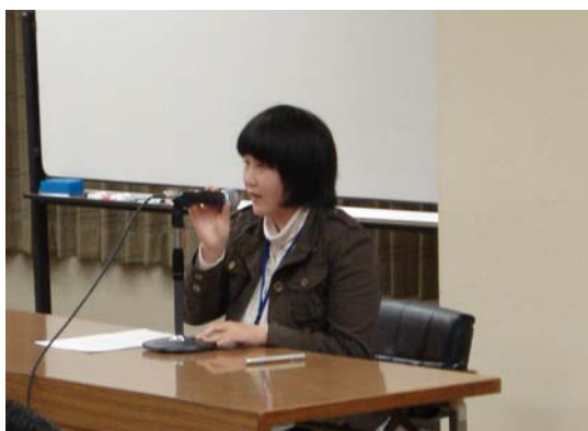
卒業生代表の意見発表