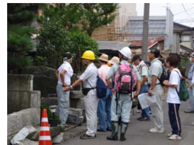
中越沖地震被災地での情報収集