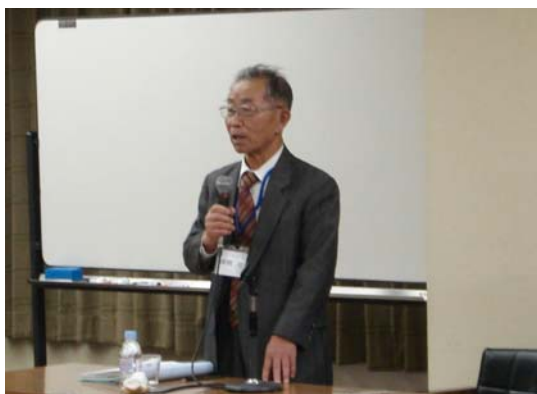
卒業生代表の意見発表

当日行われた意見発表では、「ここで学んだことを今後の自主防災会の活動に活かしたい」、「これからも安全士同士で交流し、情報交換をしながら学んでいきたい」、「3 大学の学生に是非受講してもらえるように自分が宣伝役になりたい」といった意気込みが語られました。