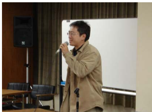
卒業生代表の意見発表