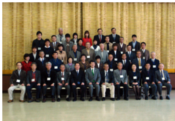
第二期生卒業写真 (中央は泉田新潟県知事)